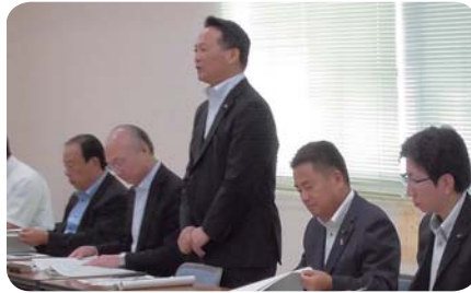
串良ふれあいセンター行政視察