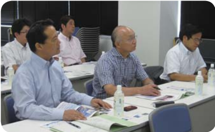
串本町防災センター行政視察