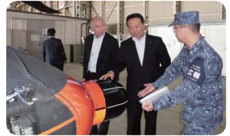
海上自衛隊鹿屋航空基地行政視察