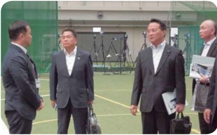
鹿屋体育大学行政視察