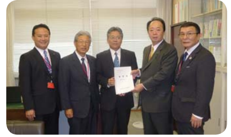
無電柱化促進議員連盟要望(国交省道路局)