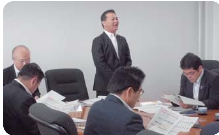
宮崎県議会行政視察