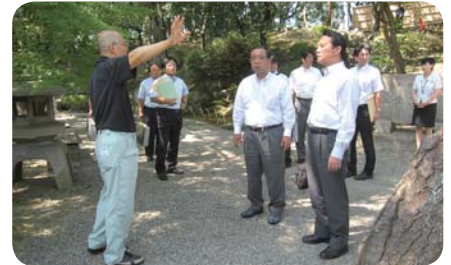
和歌山市行政視察