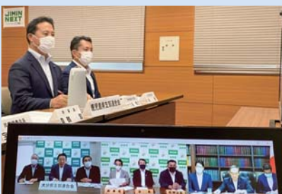
全国自民党幹事長会議 (リモート参加)