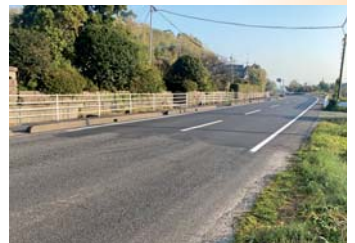
県道73号改良事業の現状