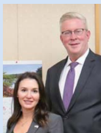
県庁にて米国大使館との安全保障について