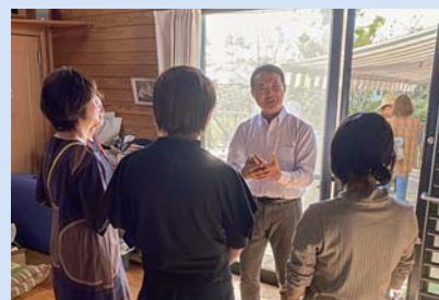
自然免疫向上講演 & マルシェでの意見交換