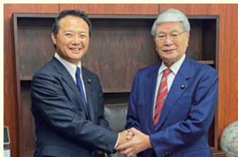
野村哲郎農林水産大臣