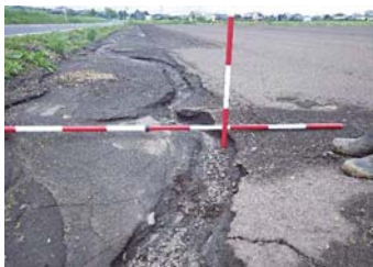
農道の表土流出状況(共栄地区)

楠隼校の共学化や全寮制の廃止は、これまでの経緯、地域の声、大隅地域の他の公立高校の生徒募集への影響等を考えると慎重な議論を行うべきであります。