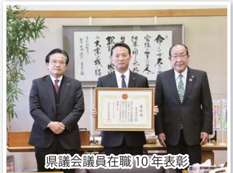
県議会議員在職10年表彰