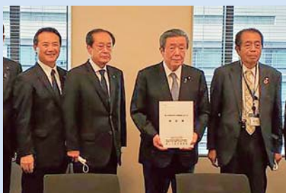
各種団体の皆様と大隅地域の道路整備要望