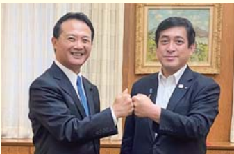
塩田康一鹿児島県知事