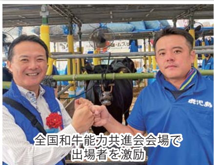
全国和牛能力共進会会場で出場者を激励