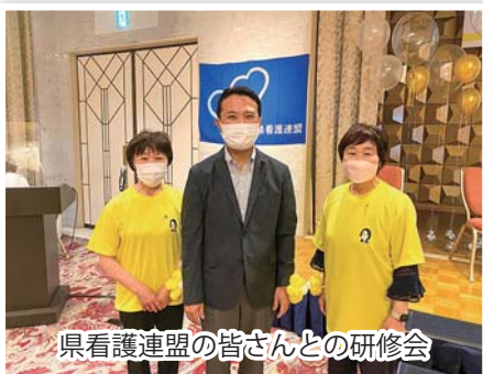
県看護連盟の皆さんとの研修会