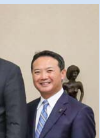
使館公使と今後の意見交換