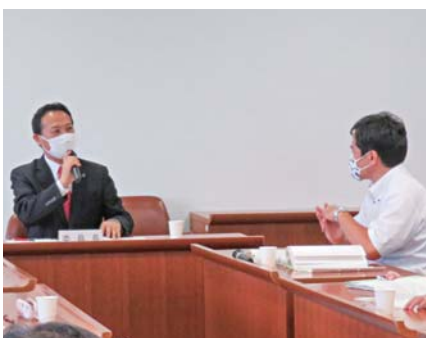
委員会での審査模様

県内全ての妊産婦とその家族が安心・安全に妊娠・出産・子育てができる社会を目指して、妊娠初期から子育て期を通じた包括的な相談支援体制の構築、産前・産後ケアの拡充と体制整備の促進、産前・産後ケアに関わる専門職の人材確保と育成強化