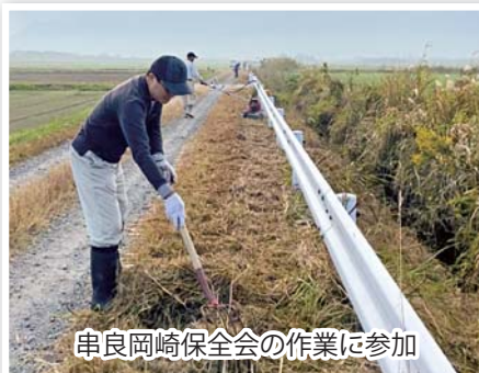
申良岡崎保全会の作業に参加