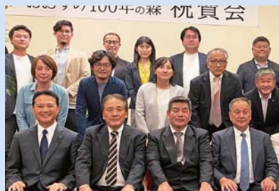
林業振興団体のNPO法人「おすみ100年の森」設立祝賀会