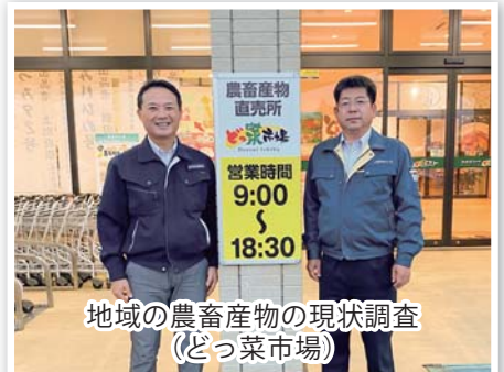
地域の農畜産物の現状調査(どっ菜市场)