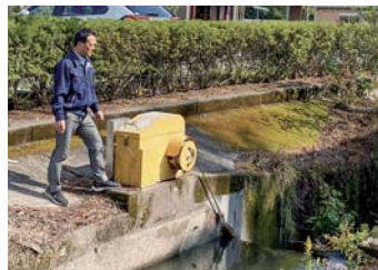
串良地区内水整備対策の有里用水