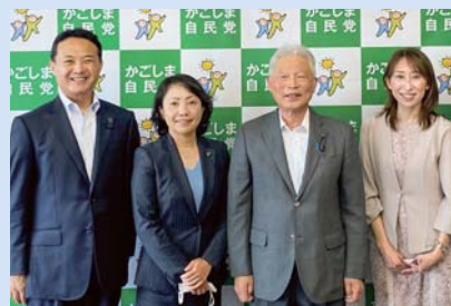
自民党鹿児島県連役員と友好団体との意見交換