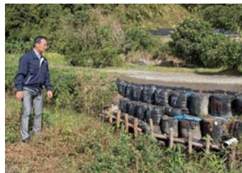
甫木川の被害状況視察