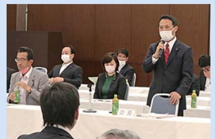
私立中学高等学校協会との意見交換会(私学振興調査会)